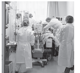
コロナ専用病棟での治療。感染者急増の時期、医療崩壊の懸念に緊張が高まりました。

支はギリギリです。コロナの暴風でみんないっぱんに吹き飛ばされました。先日、政府は医療関係者のためとしてブルーインパルスを飛ばさなかったが、立川には来ませんでした。自衛隊関係者の気持ちには感謝しつつも、立川にきてくれたら、イヤミの1つも。「そのヒコキ売ってこっちに回せ」