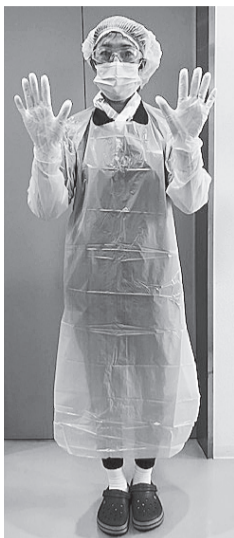
発熱など感染疑いのある利用者さん宅へは、全身の感染防護具を着用して訪問します。