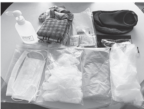
訪問時に持参する感染対策用品の数々

外出自粛が続く中で、利用者さんたちの生活や体調にも変化が現れてきています。趣味サークル・お茶会などの地域のコミュニティへの参加、散歩を兼ねた買い物など、これまで生活のリズムを支えていた「小さな日課」が失われていきます。「そのインパクトは予想以上に大きく、