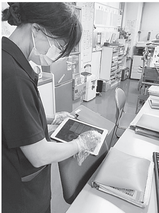
訪問から戻るときに、使用した持ち物はすべて、かばんから中身までアルコール消毒を行います。時間はかかりますが、感染防止のための大切な作業です。

自宅での療養生活を支える訪問看護。健生会には8つの訪問看護ステーション（以下、訪看St）があり、約900人の利用者さんを訪問しています。家の中という密な空間で直接ケアを行い、患者さんの発熱も日常的に起こりうる。病院同様、新型コロナウイルス感染の危険を伴う最前線の現場と言えます。感染防護具などが不足する中で感染対策に苦慮しながらも、訪問を続けるスタッフに、訪問看護の現場で何が起こっているのかを聞きました。