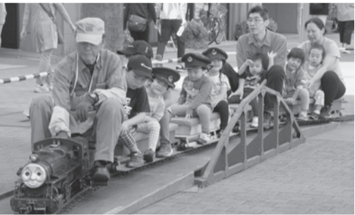
子どもに大人気のミニSL