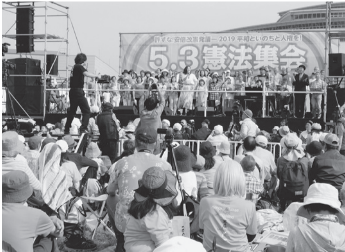
会場とともに「翼をください」を大合唱