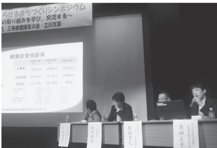
登壇した4人がそれぞれのとりくみを紹介