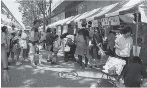
家族連れなどでにぎわう会場内