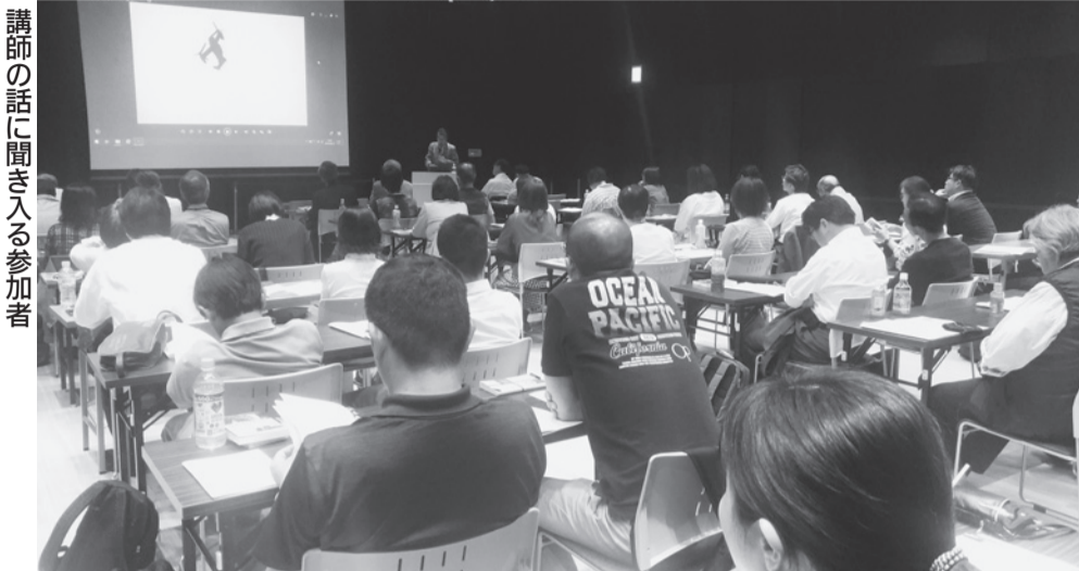
講師の話に聞き入る参加者

社会医療法人社団健生会・広報紙 〒190-0022 東京都立川市錦町1-23-25 発行●広報委員会 電話 (042)523-2375 FAX (042)528-2860 URL: http://www.t-kenseikai.jp/ E-mail: izumi@t-kenseikai.jp 2019年6月5日 No.546