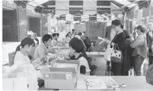
健康チェックに長い行列が