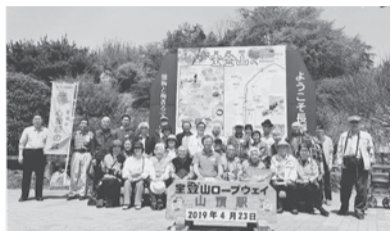
みんなで集合写真

心臓病患者会・心臓友の会は4月23日、春の日帰り旅行で秩父長瀨（ながとろ）に行きました。半袖でも少し汗ばむ陽気のなか、宝登山のロープウェイか