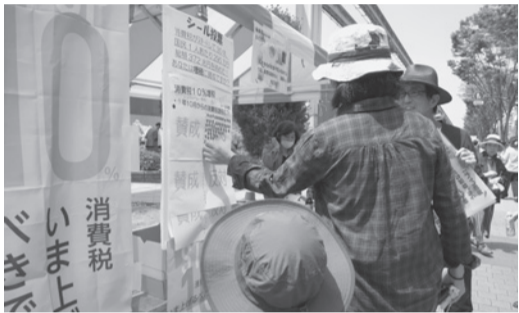
消費税増税「反対」にシールをペタリ