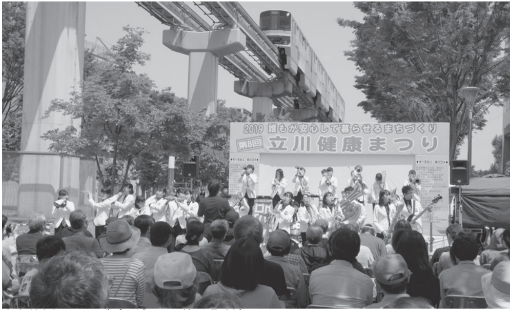
さまざまなステージプログラムに拍手喝采が