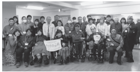
ポッチャを楽しみました

リハビリ患者会・たけのこ会は4月6日、春のつどい「花より団子の会」を開き、会員17人、リハビリ新入職員5人、その他職員6人が参加しました。