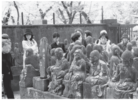
様々な表情の五百羅漢が

会」は10月5日、小江戸・川越へバスハイクに行きました。会員さん12人、職員6人が参加しまし