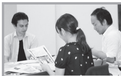
資料を見ながら話しあう

田基地と米軍の戦略」と題し、横田基地の現状を報告しました。パネルディスカッションでは、3月に実行委員会がとりくんだ基地周辺住民へのアンケート結果が報告されました。750人が回答し、基地周辺に住む人たちは、墜落を繰り返すオスプレイへの不安を感じながら生活している実態が明らかになりました。集会後、福生駅までデモ行進し、「基地はいらない」などコールしました。