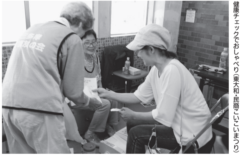
健康チエックでおしゃべり(東大和・民商こいこまつり)

ひのだい健康まつりは30年ぶりの開催。三多摩健康友の会日野支部と日野台診療所をはじめとする市内の健生会グループ5事業所が実行委員会をつくり、この日におむね準備を重ねてきました。ほかに