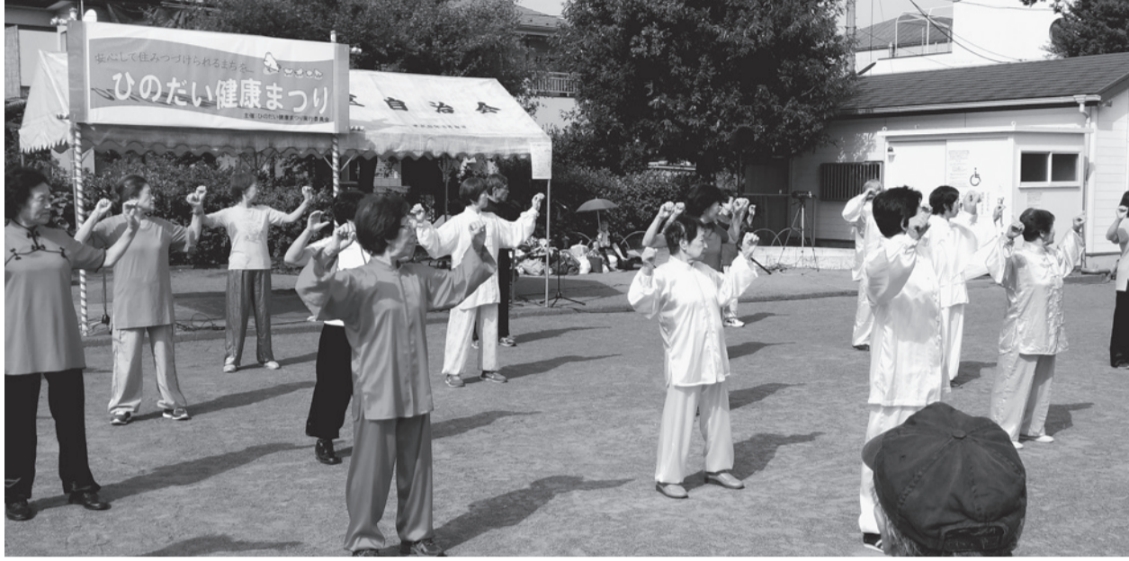
太極拳サークルの演武でオープニング(ひのだい健康まつり)

社会医療法人社団健生会・広報紙 〒190-0022 東京都立川市錦町1-23-25 発行●広報委員会 電話 (042)523-2375 FAX (042)528-2860 URL: http://www.t-kenseikai.jp/ E-mail: izumi@t-kenseikai.jp 2017年11月5日 No.527